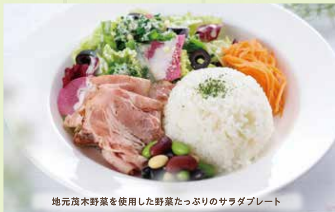
地元茂木野菜を使用した野菜たっぷりのサラダプレート