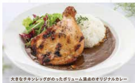
大きなチキンレッグがのったボリューム満点のオリジナルカレー