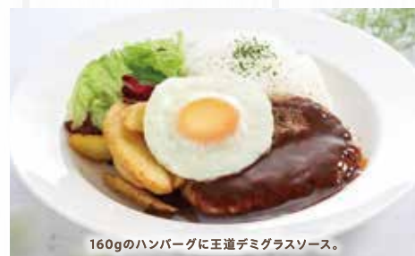
160gのハンバーグに王道デミグラスソース。