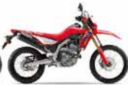
単体色: エクストリームレッド CRF250L(s)