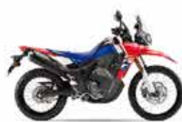
単体色: エクストリームレッド CRF250 RALLY