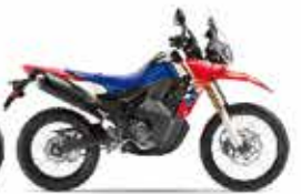
単体色: エクストリームレッド CRF250 RALLY(s)