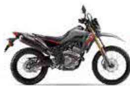
単体色: スウィフトグレー CRF250L